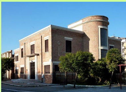
Viale Libertà, n. 1