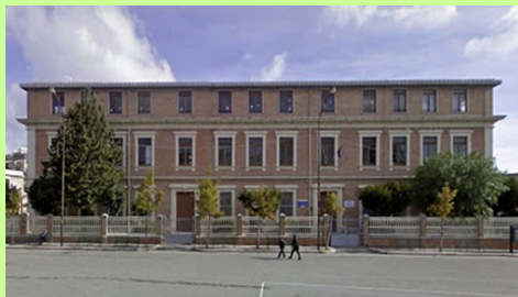
P.zza Matteotti n. 1