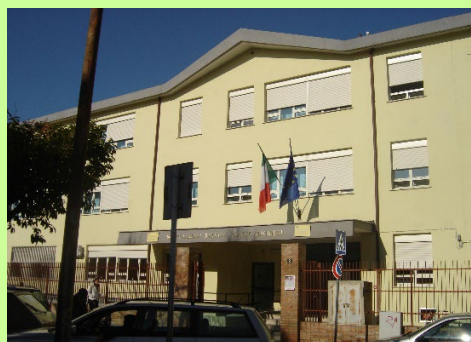
Viale Dante n. 2

SCUOLA SECONDARIA DI 1° GRADO DANTE ALIGHIERI